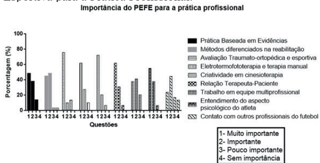
Figura 3 - Importância do Projeto de Extensão em Fisioterapia Esportiva para a Prática Profissional.

Em relação à importância atribuída ao PEFE para prática atual dos fisioterapeutas, pôde-se observar que seis questões obtiveram maioria das respostas classificadas como MI e, três questões como I, com destaque para a implementação de métodos diferenciados de reabilitação, trabalho em equipe multiprofissional e contato com profissionais relacionados ao futebol (Figura 3).