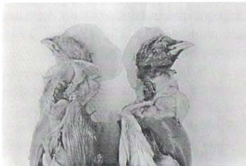
Figura 2: celulite tipo I na região cervical de pintos.

Singer et al. (1999) demonstraram que amostras de E. coli isoladas de granjas de diferentes integrações diferem do ponto de vista genético. Entretanto, amostras isoladas de aves da mesma integração, provenientes de diferentes granjas, apresentam grande similaridade, indicando que estas amostras podem se distribuir de forma endêmica. As amostras de E. coli envolvidas em surtos de celulite em frangos de corte podem permanecer viáveis por 3 a 4 criações sucessivas (Singer et al. , 2000).