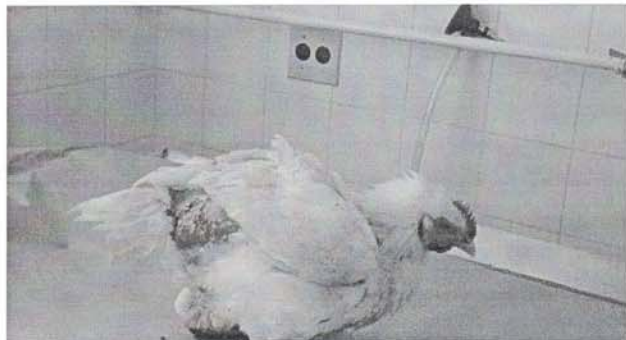
Figura 3: celulite tipo II em frangos de corte causada por arranhões.